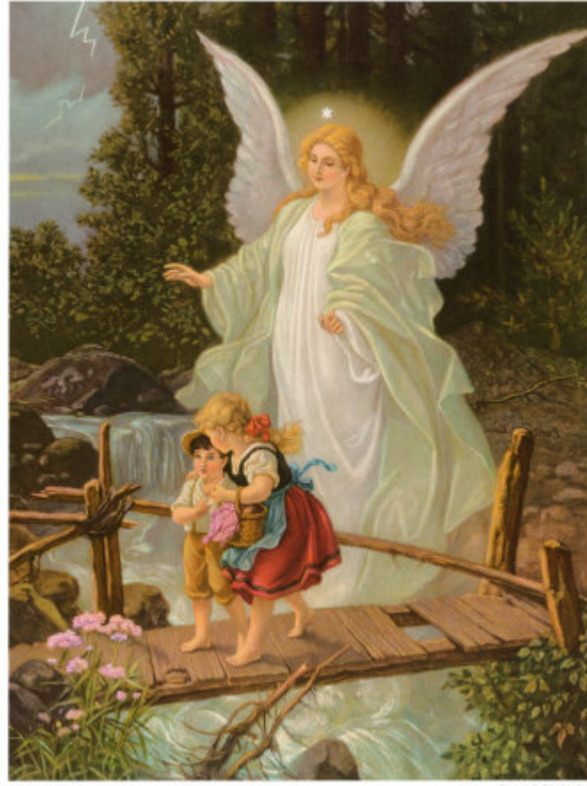
Brückenbild um 1900