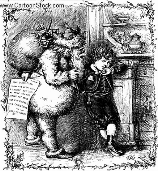
Santa Claus's Rebuke. "I'll never do it again."