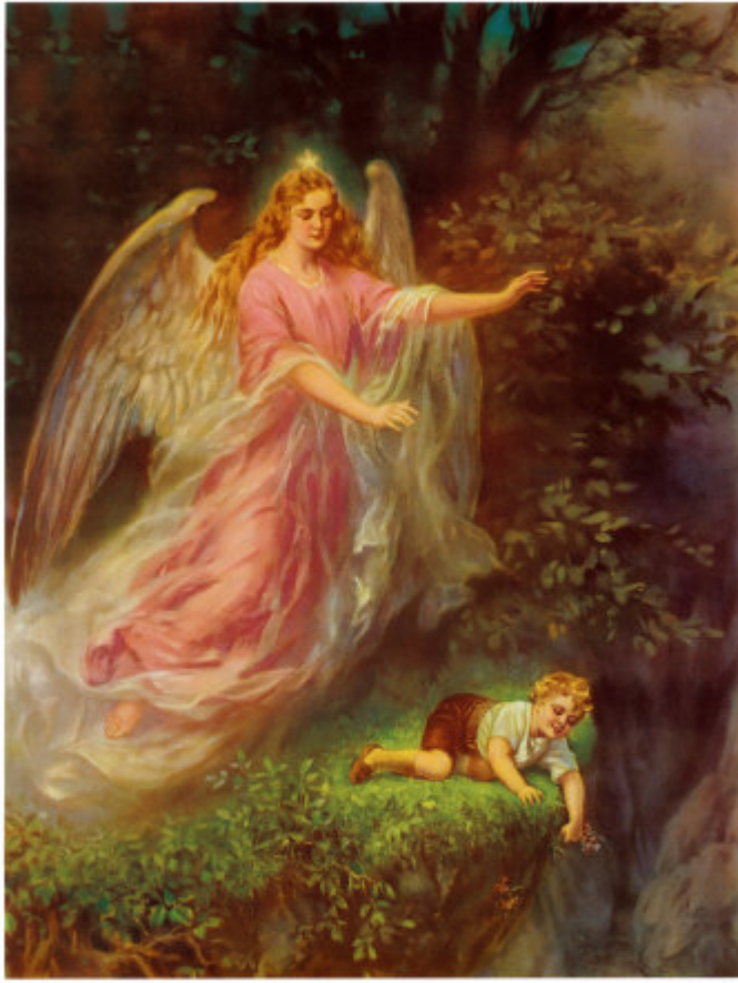
Abgrundbild um 1900